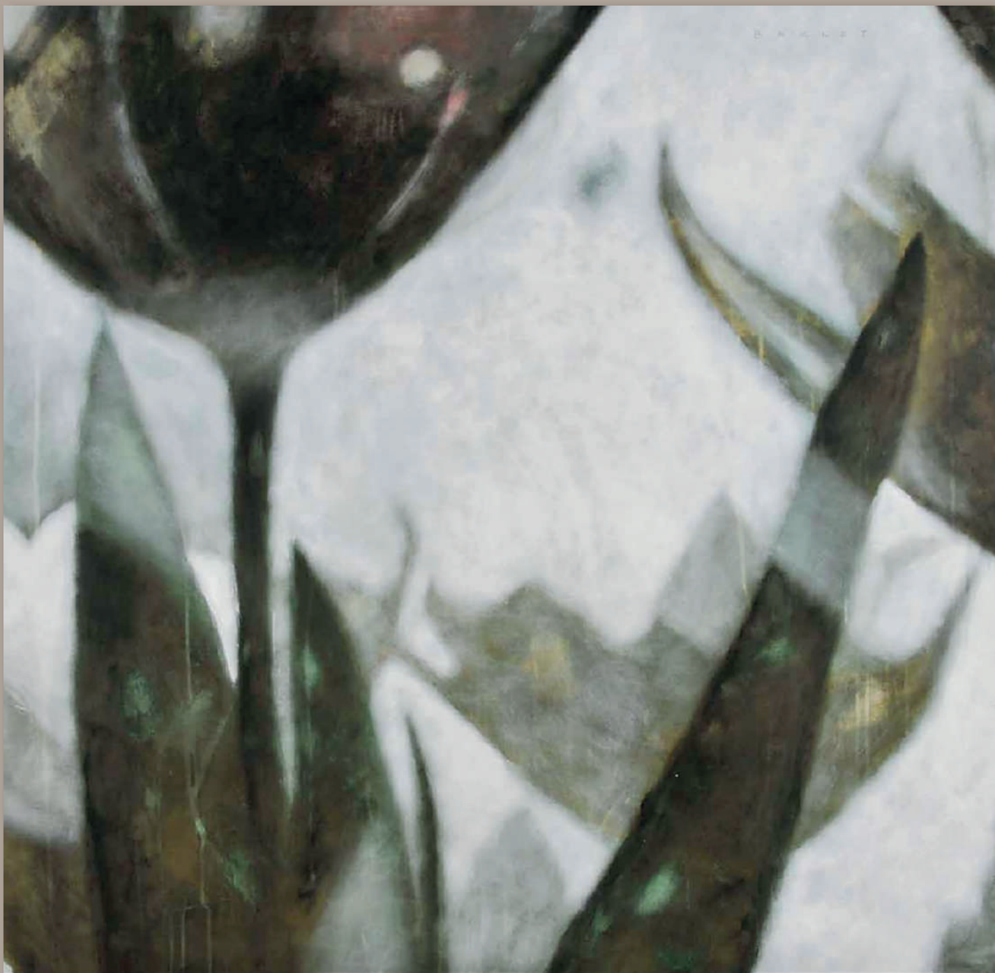
RIFLESSI Acrilici e pigmenti metallici su tela cm 120 x 120