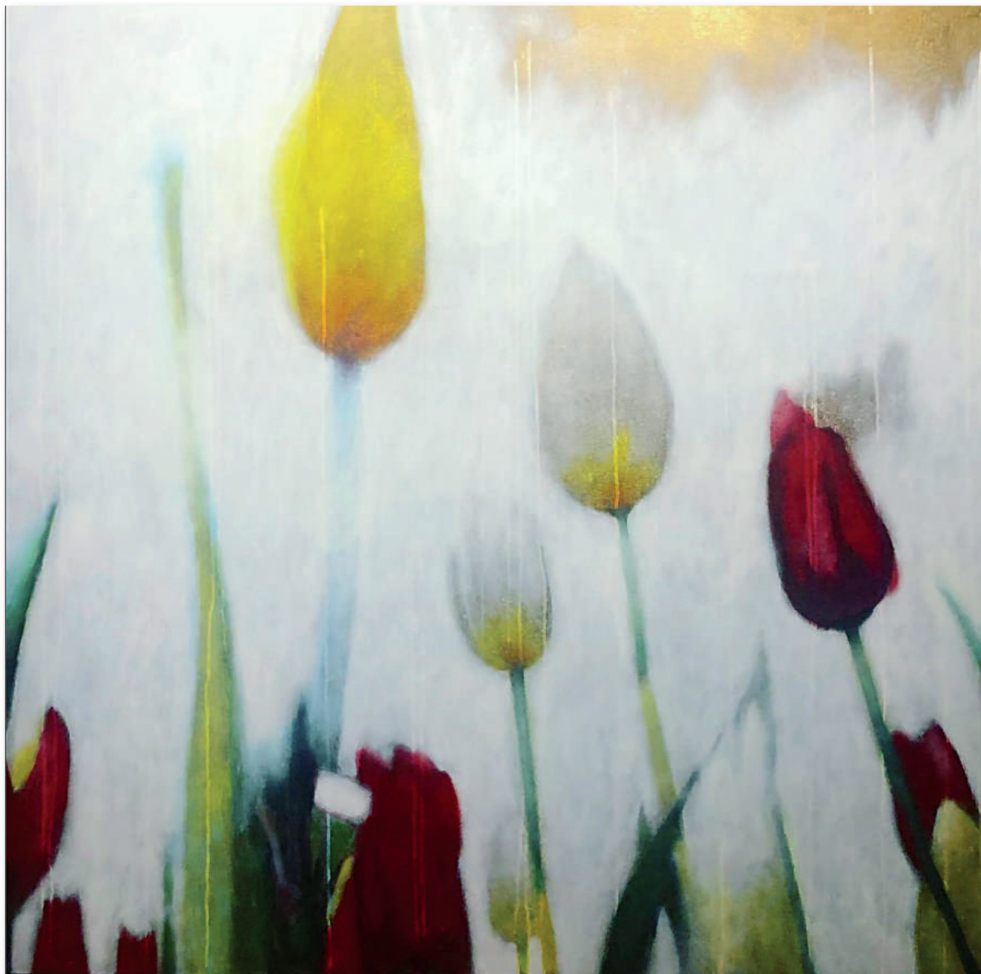
BOLOWIN'IN THE WIND Acrilici e pigmenti metallici su tela cm 150 x 150