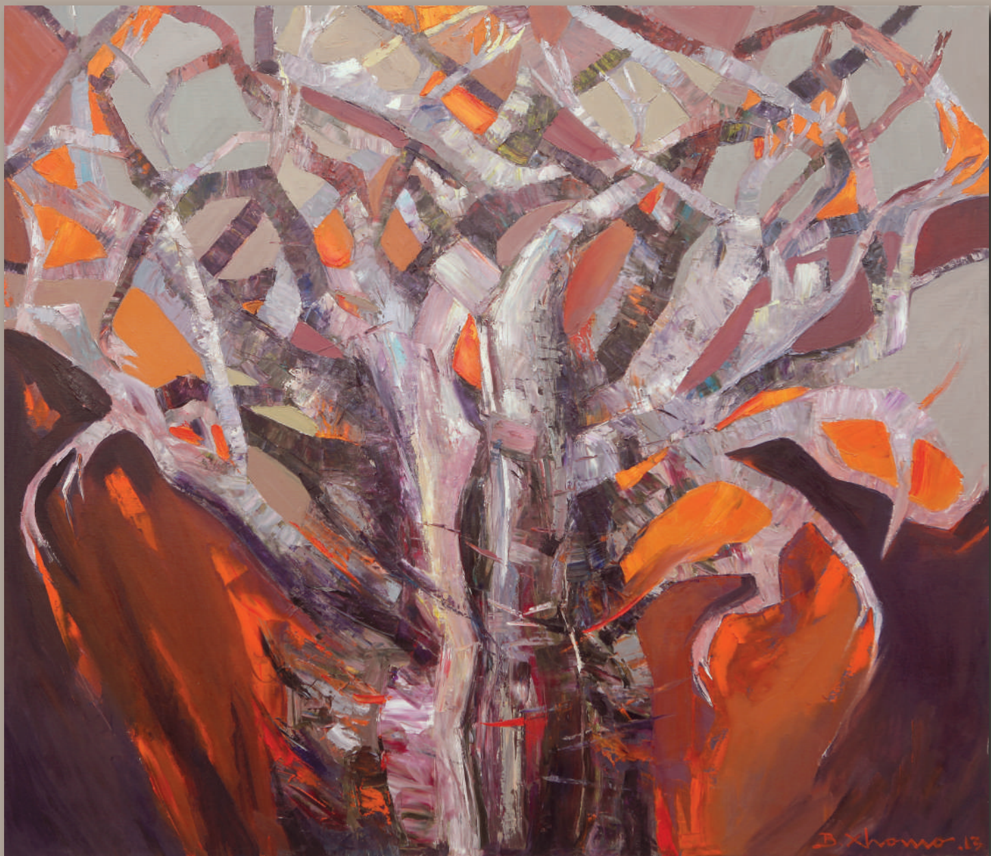
ALBERO DELLA VITA - TREE OF LIFE, olio su tela cm 120 x 140