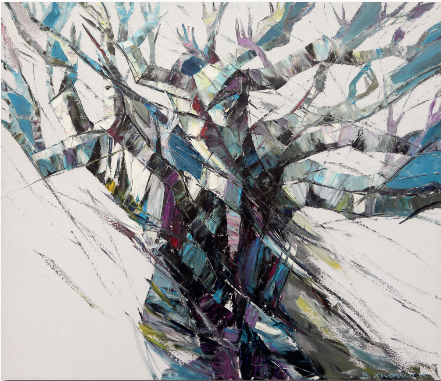
EVOLUZIONE UMANA - HUMAN EVOLUTION, olio su tela cm 120 x 140