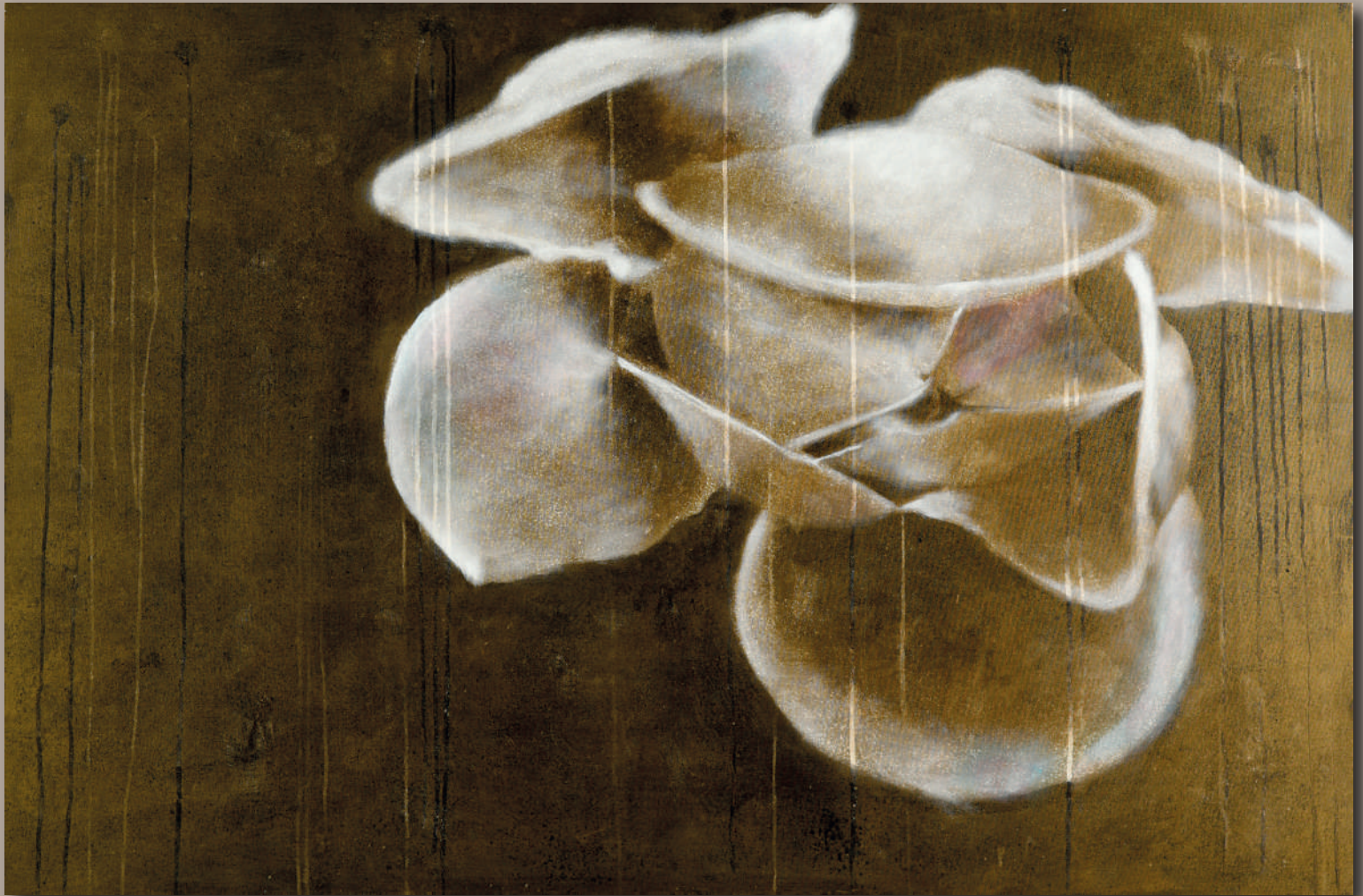
HOPE Acrilici e pigmenti metallici su tela cm 150 X 100