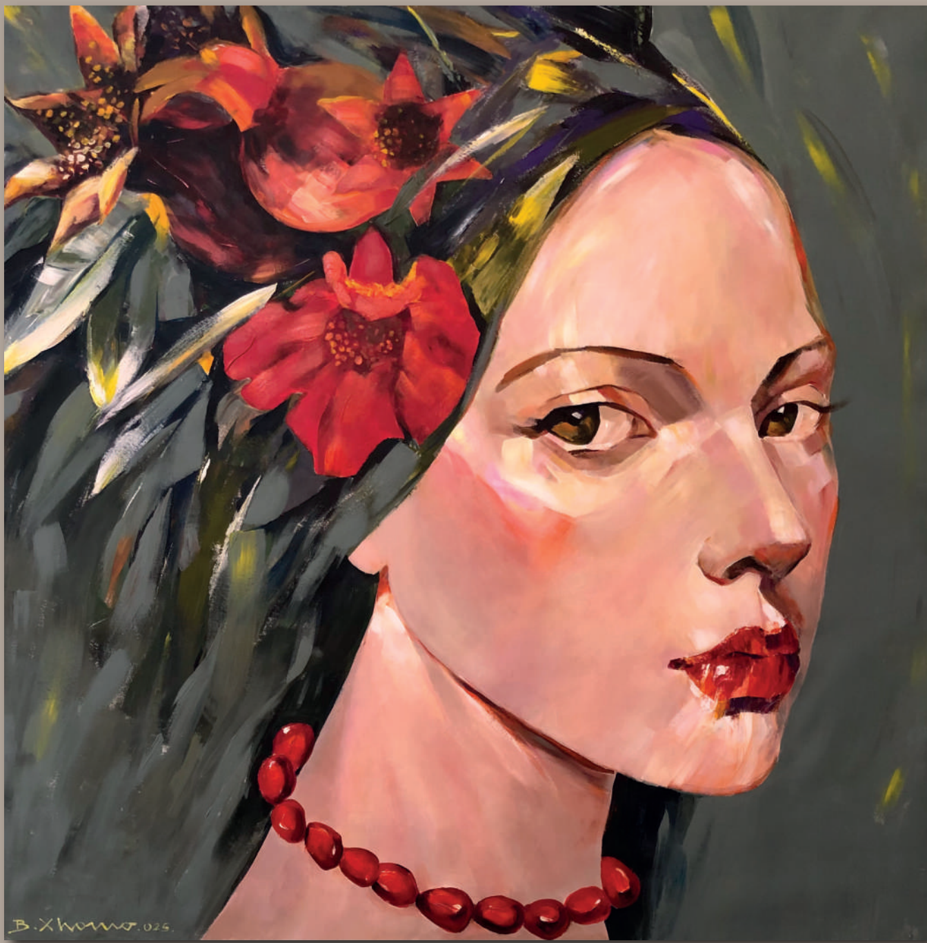
CORONA DI MELOGRANO - POMEGRANATE CROWN, Acrilico su tela cm 140 x 140