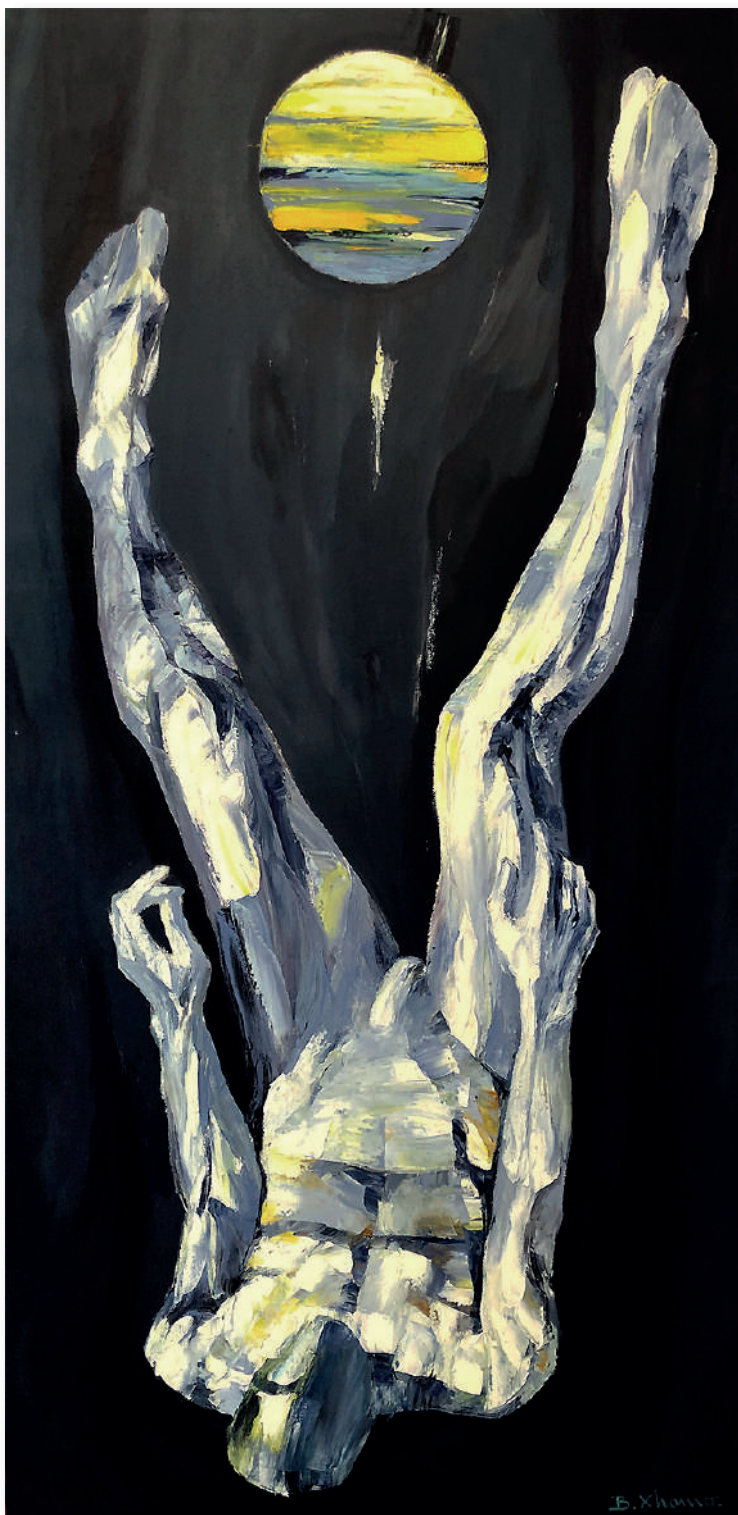
VITA 2 - LIFE 2, olio su tela cm 100 x 200