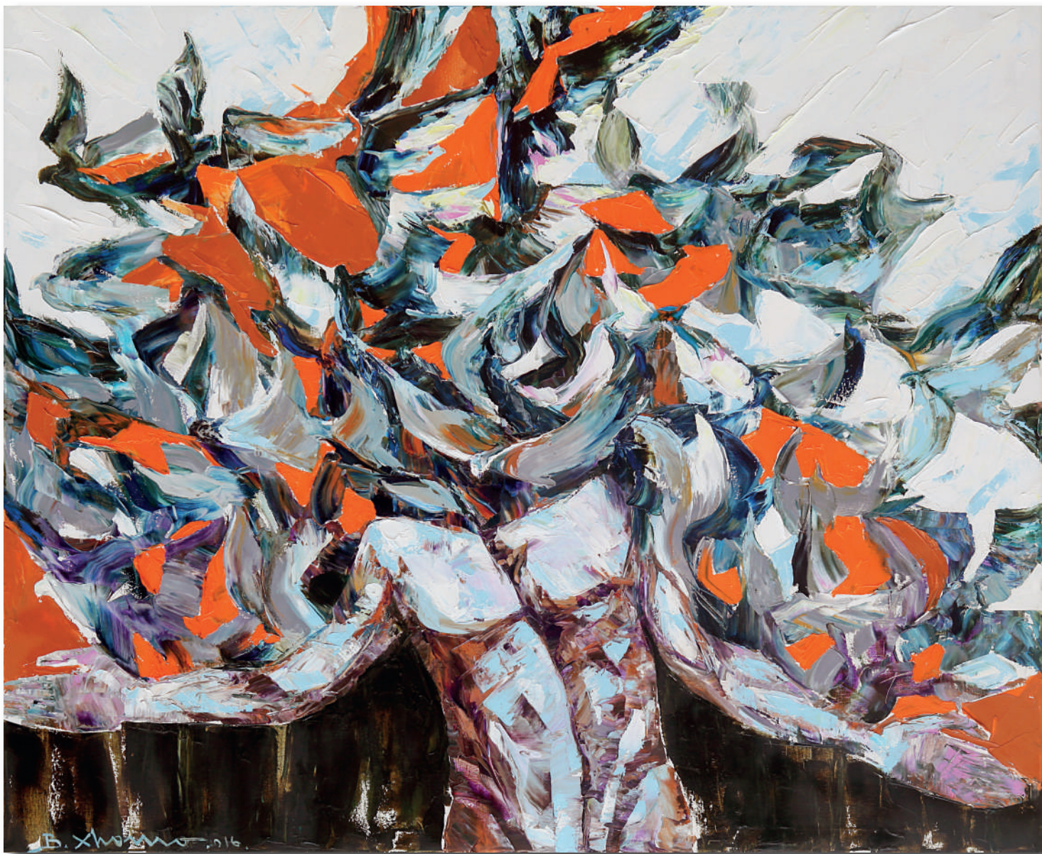
LIBERTÀ DELL'ANIMA, FREEDOM OF THE SOUL