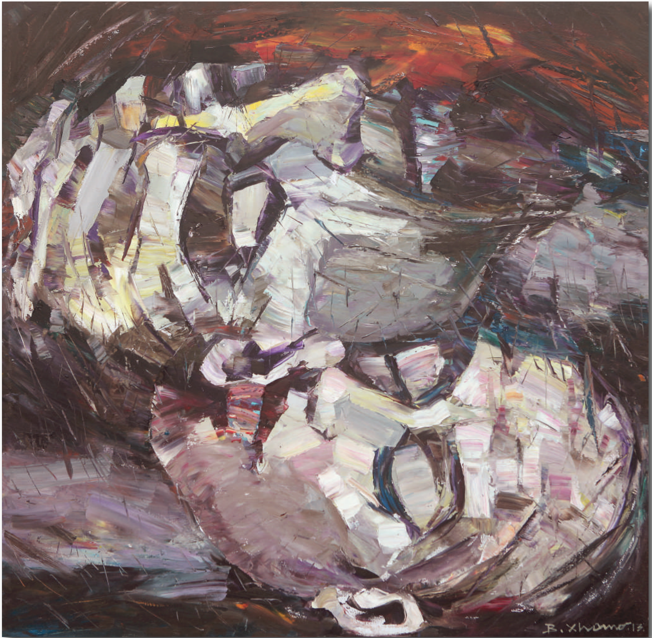
FUGA SENZA CONFINI - ESCAPE WITHOUT BORDERS, olio su tela cm 120 x 120