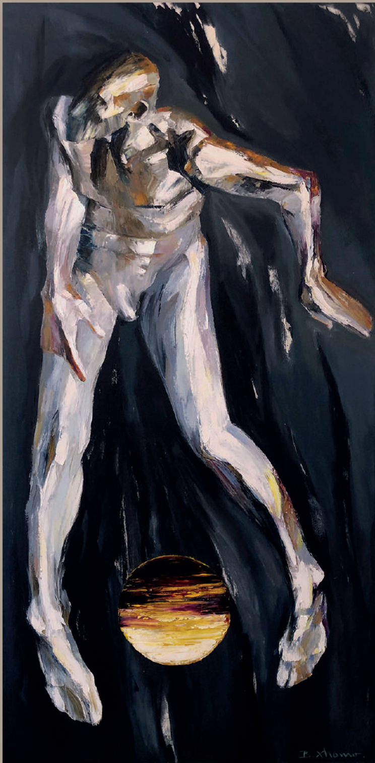
VITA 1 - LIFE 1, olio su tela cm 100 x 200