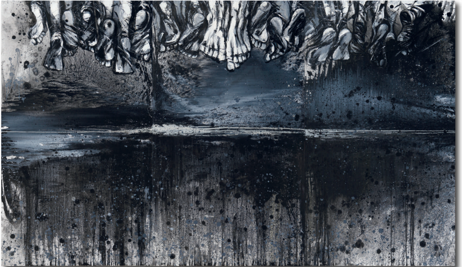
OLTRE LA FUGA - BEYOND THE ESCAPE, olio su tela cm 140 x 140