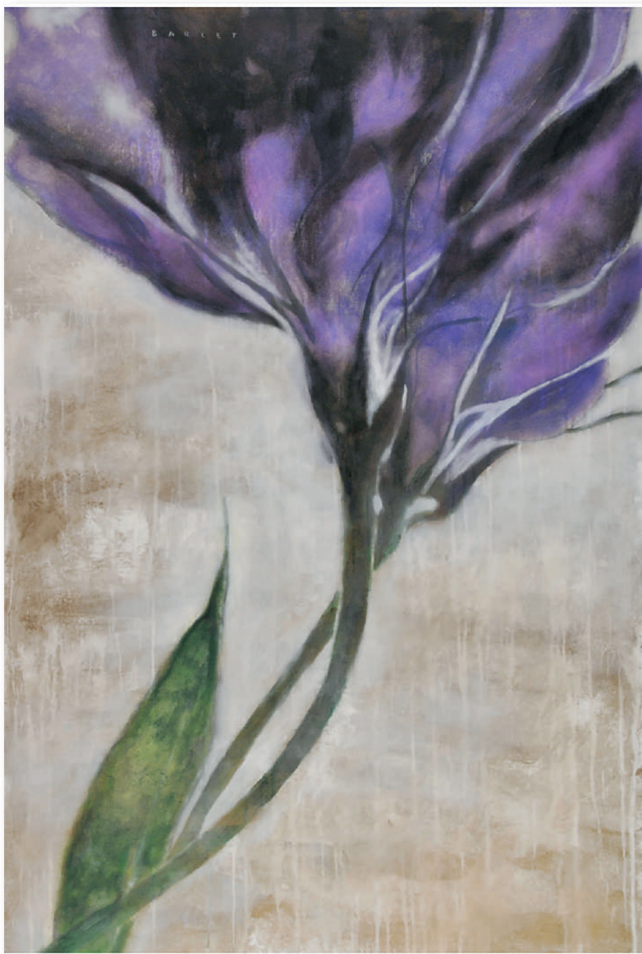
CHELSEA Acrilici e pigmenti metallici su tela cm 100 x 150