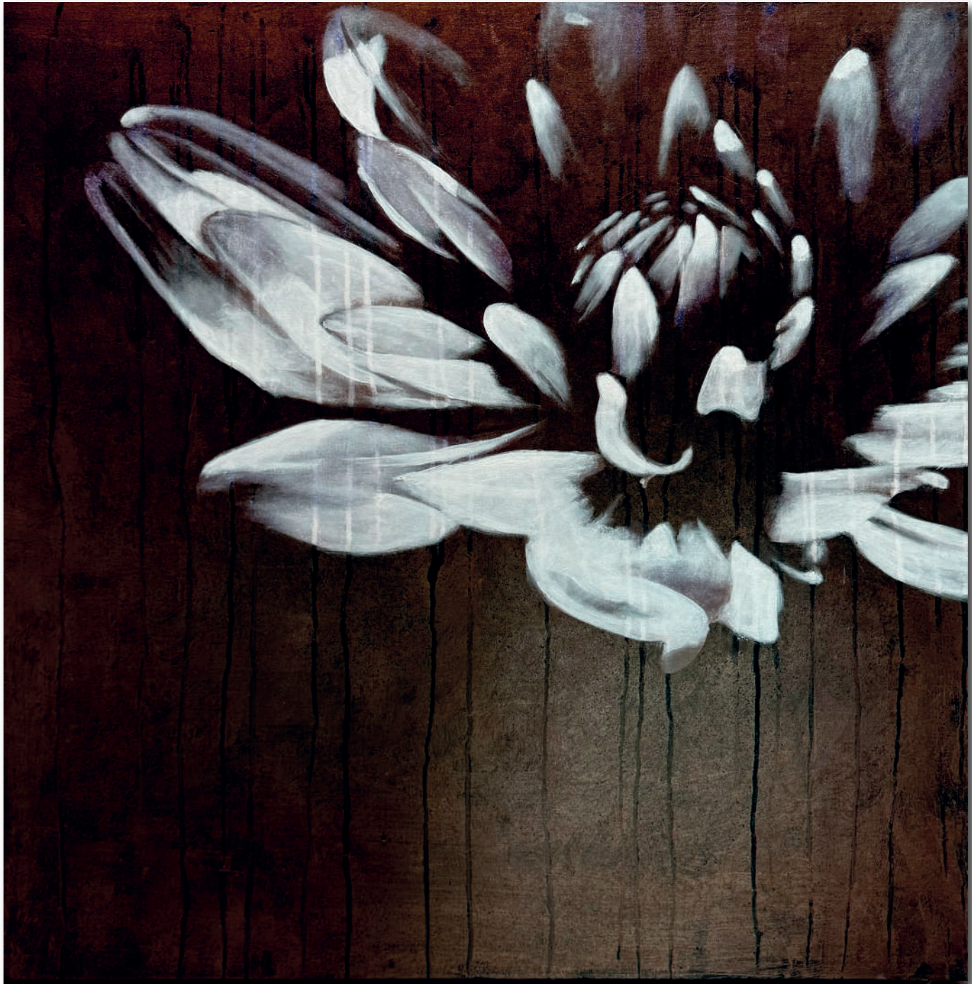
OLOS Acrilici e pigmenti metallici su tela cm 90 x 90