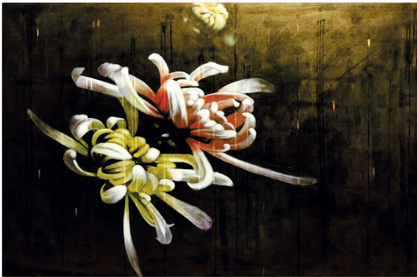
STIAMO VOLANDO Acrilici e pigmenti metallici su tela cm 150 x 100