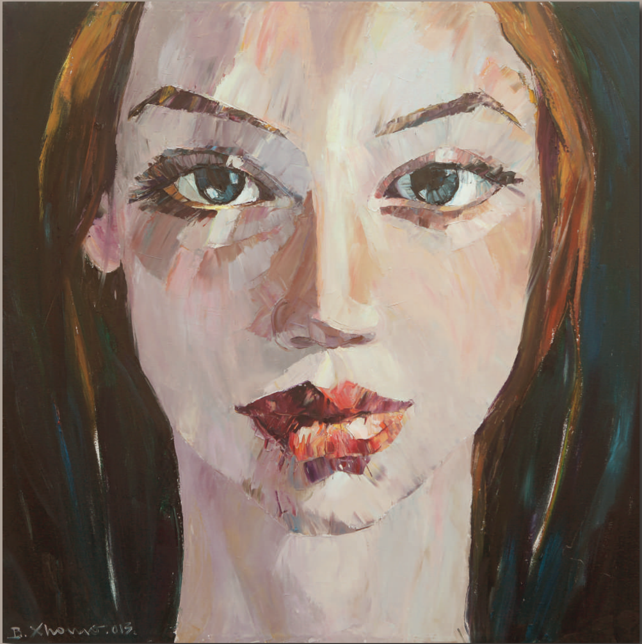
KALTRA, olio su tela cm 120 x 120