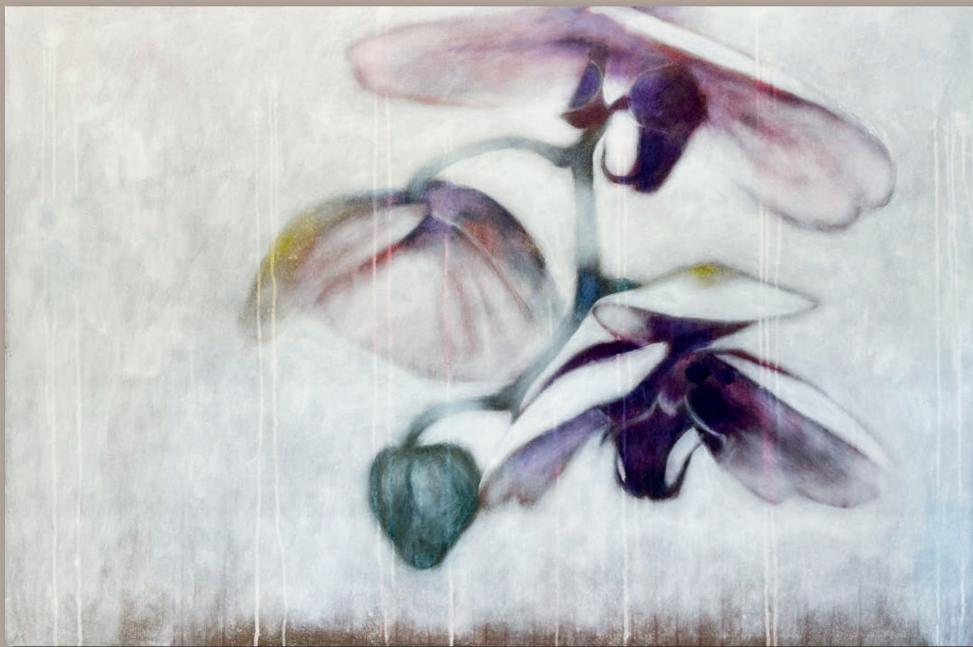
ORCHIDEA Acrilici e pigmenti metallici su tela cm 150 x 100