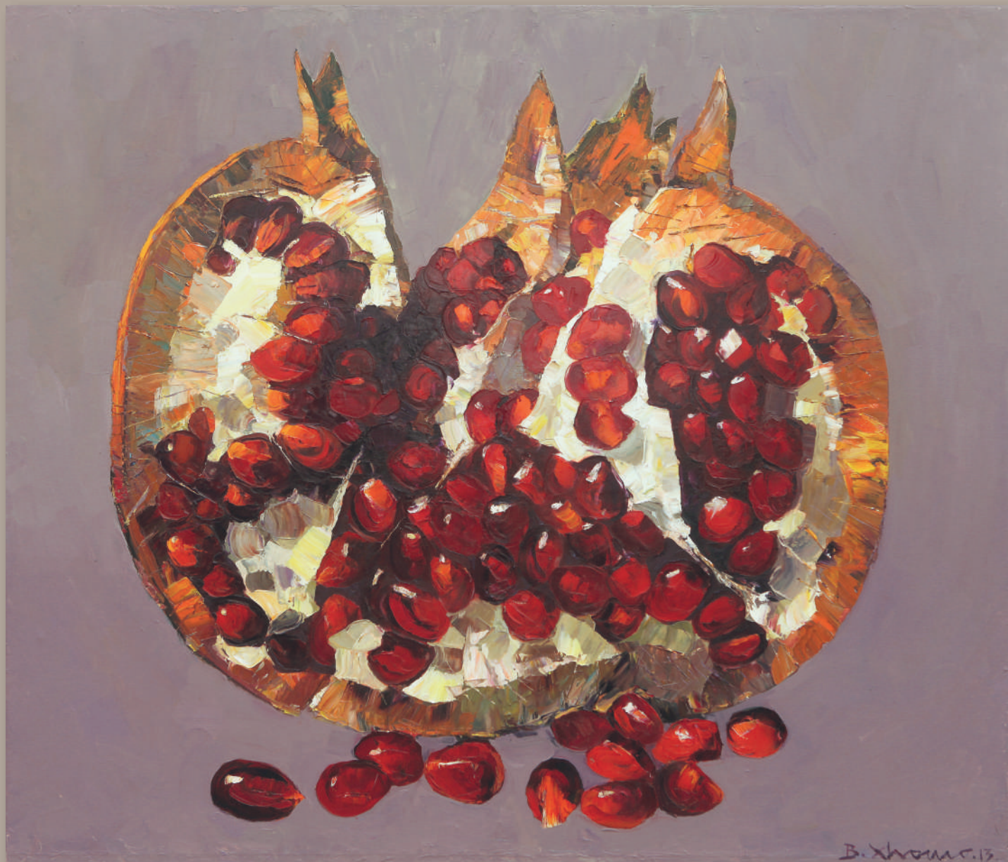
LA CASA DEGLI SPIRITI ROSSI - THE HOUSE OF THE RED SPIRITS, olio su tela cm 140 x 140