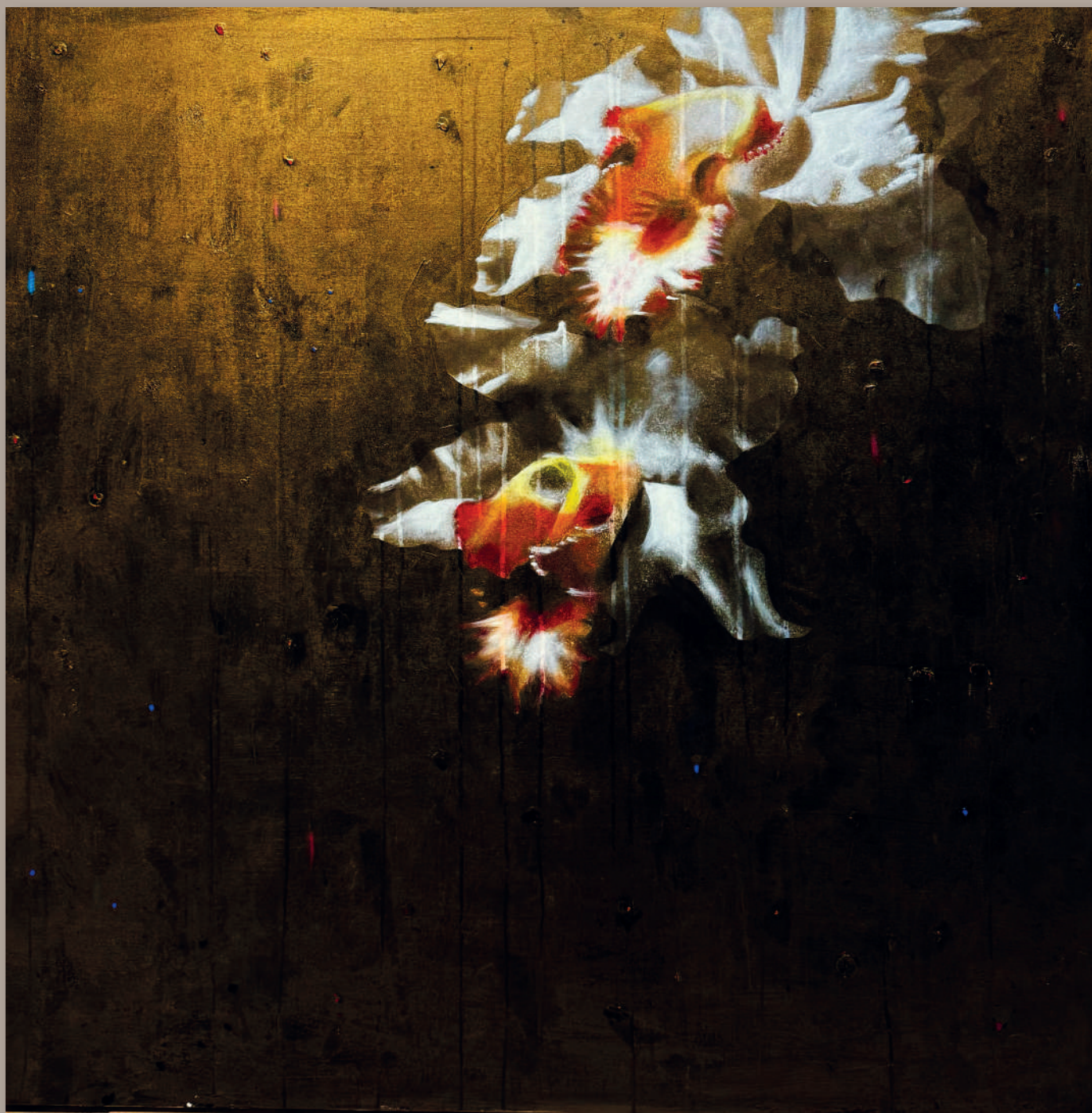
LA SERA DEI MIRACOLI Acrilici e pigmenti metallici su tela cm 120 x 120