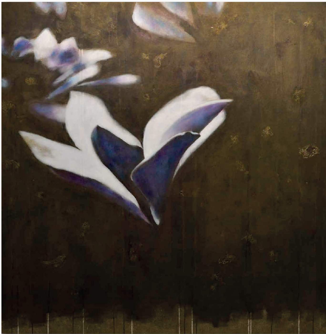
MAGNOLIA Acrilici e pigmenti metallici su tela cm 120 x 120